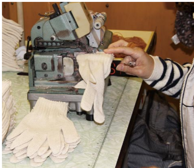
オーバーロック工程