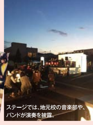
ステージでは、地元校の音楽部や、バンドが演奏を披露。