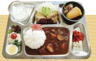
呉ハイカラ食堂(潜水艦そうりゅう)