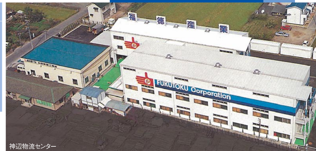
神辺物流センター

商号 / 福徳産業株式会社 本社 / 広島県福山市千田町2-44-14 神辺物流センター / 広島県福山市神辺町川南1318-2 設立 / 昭和43年8月 資本金 / 7,000万円 事業内容 / 手袋と靴下の製造販売, その他 作業用品の販売 関連会社 / エキヤ産業株式会社