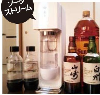
ソーダストリーム

「炭酸水ってこんなにうまくいったのか！これが本製品を初めて使ったときの感想です。水道水で作るのですが、浄水器を通しているからか混じり気のないピュアな炭酸水ができます。消耗品のガスシリンドラ（ボンベ）の消費量は我が家（夫婦ふたり）のペースで月一本です（一本二千円＋消費税）。本製品に対応したシロップも販売されていますので、炭酸ジュースを作ることもできます。料理に使ったり洗顔に使ったりする利用方法もあるようです。 興味のある方はメーカーのHP「ソーダストリーム」で検索してください。