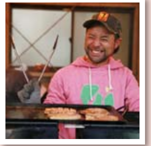
お店の人との会話が楽しめるのも魅力。

2015年10月某日の終業後、「さあ、自宅へ帰ろう」と社外へ出ると、弊社周辺がなんだかいつも違う雰囲気…。ソニビのメイクを施した若者や、アニメキャラクターになりきった子どもたちでにぎわっていました。福山卸センターの駐車場には、美味しそうな食べ物を販売するブースや、おしゃれな雑貨が並ぶテント、ライブやパフォーマンスが行われるステージが設置されています。なにやら楽しそうな空気に誘われて、辺りを少し歩いてみることにしました。