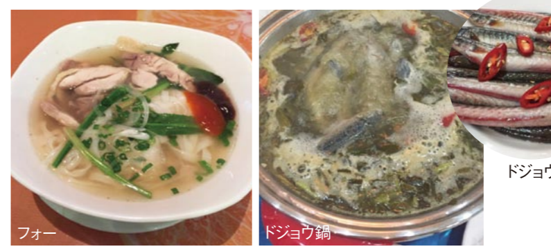
フォー ドジョウ鍋

また、信号待ちの様子はまるでレースが始まる場面さながら。道を渡るのも一苦労といったところです。この季節、日本は秋の涼しさが寒く感じる時期でしたが、ベトナムの気温は三十三度。でも蒸し暑くはありませんでした。ベトナム国土は、ゆるくS字型にカーブしながら南北に一六五〇kmと長い国土を持つため、気候は多様で地方ごと特色があるようです。さて、気になるのはベトナムの食事情。色々と思うところがありました。ベトナムで食べた物を紹介します。