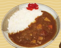
多幸膳(呉基地業務隊)