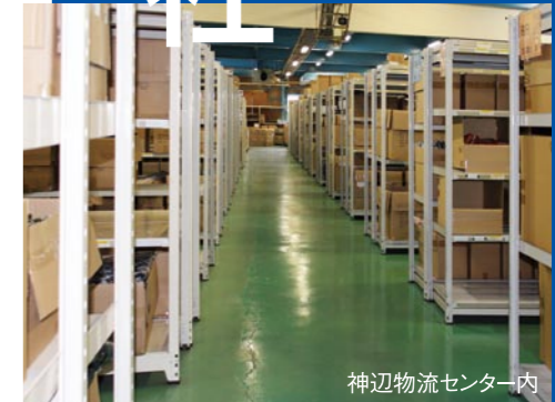
神辺物流センター内