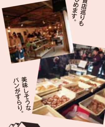
美味しそうなパンがずらり。

この日開催されていたのは、福山市卸町の発展を願って行われているまちづくりプロジェクト「STOREHOUSE」というイベントです。2013年にスタートし、既に10回目（知らなかった!）。年3回開催されているらしく、私が目にした日は、ハロウィンということもあり、仮装をした人々が多く見られました。