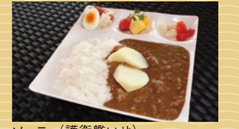
ソーニョ(護衛艦いせ)