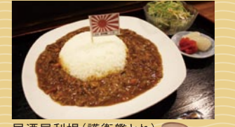
居酒屋利根(護衛艦とね)