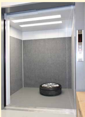
納入/2018年4月 型式/ルームレスロープ式 積載/人荷用 1,100kg 16名 ケーシ寸法(mm)/1800W×1400L×2100H