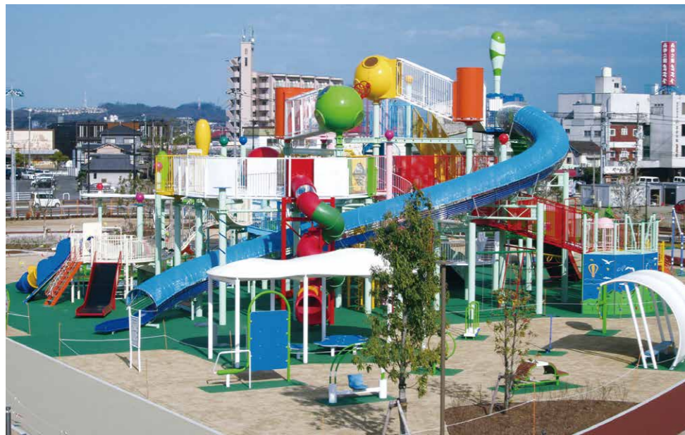
福山市内最大級の大型遊具を設置した公園。

この一大プロジェクトのエレベーターには、弊社ニチウン製品をご採用いただきました。メインアリーナとサブアリーナへ